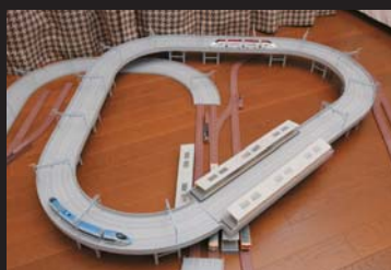
新幹線高架のレイアウト変更