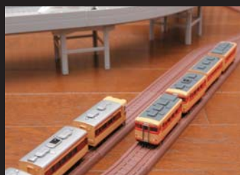
単線の支線を新設

エンドレスで単調な運転となるため、小判形から「おにぎり」形へレイアウトを変更。それにより1周の走行距離も長くなった。