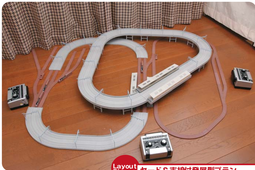
Layout Plan ヤード&支線付発展型プラン

運転本数の多い本線で車輦の入れ替えを楽しむため上下線共にヤードを設置。渡り線を使用すれば、支線の車輦も入れ替えすることができる。