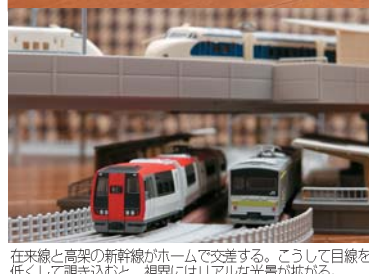
在来線と高架の新幹線がホームで交差する。こうして視線を低くして覗き込むと、視界にはリアルな光景が広がる。

複線レールと複線高架レールを、駅ホームで交差するようにレイアウトし、新幹線と在来線の接続駅といった雰囲気にしてみた。新幹線と在来線を別々の線路に分けることにより、実物同様のリアルな運転を楽しむことができる。