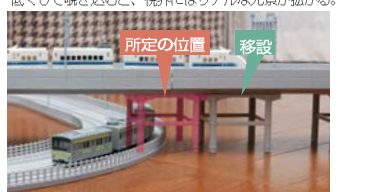
複線レールに高架レールの橋脚が重なってしまうので、橋脚を所定の取付位置より少し移動している。