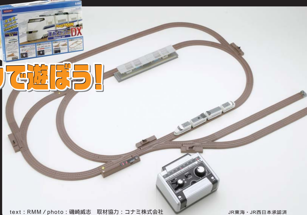
text : RMM 取材協力 : コナミ株式会社

車輛、レール、アクセサリ類まで含め、いよいよシステムとして充実してきたコナミ・デジQトレイン。中でも今年発売された電動ポイントレールは、デジQトレインが真価を発揮するために不可欠な最重要アイテムと言えるだろう。そしてこのたび、この電動ポイントレールを含むまったく新しい入門セットが発売されることになった。運転セットDXと名付けられたこの夢のオールインワンセットで、冬の夜長をデジQトレイン三昧で過ごしてみてはいかがかな？