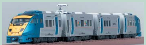
▲883系ソニック。メタリックカラーの車体色や表記類の表現もばっちりだ。

往年の国鉄車輻をはじめ決めのラインナップが話題のデジQトレインだが、第5弾ではまさしく現代を代表する鉄道車輻、JR九州の特急3種が登場するぞ! 顔ぶれは787系つばめ、883系ソニック、そして885系か