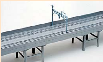
▲複線高架レールのクローズアップ。長さや曲線半径は複線レールと同様。