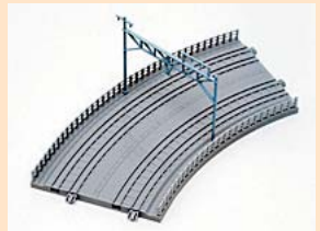
▲複線レール曲線。曲線半径は内側R220、外側R264。