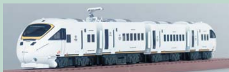
▲885系かもめ。個性的なJR九州車輛群の中でも特に人気がある車輛だ。JR九州承認済