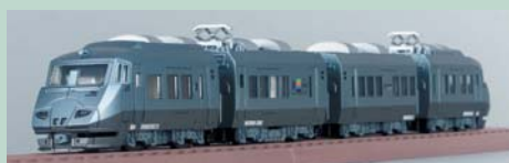
▲787系つばめ。特徴ある顔つきもしっかりと再現されている。

もめ。いずれも斬新なデザインで鉄道界の話題をさらった銘車であることはご存じの通りだ。発売は9月の予定。待ち遠しい〜。