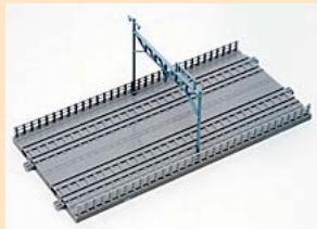
▲複線レール直線。長さ198mmだ。