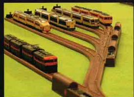
▲レールヤードに並んだ列車たちが自在に操る楽しみも電動ポイントの登場で可能になった。

発売を前にして、計40名に電動ポイントレールが当たる太っ腹キャンペーンを実施中! 期間は4月1日～5月15日。下記のHPIにアクセスして、応募フォーム上に必要事項を入力の上送信すればOKだ。期間中は何度でも応募できる。 http://www.micro-ir.com/train/